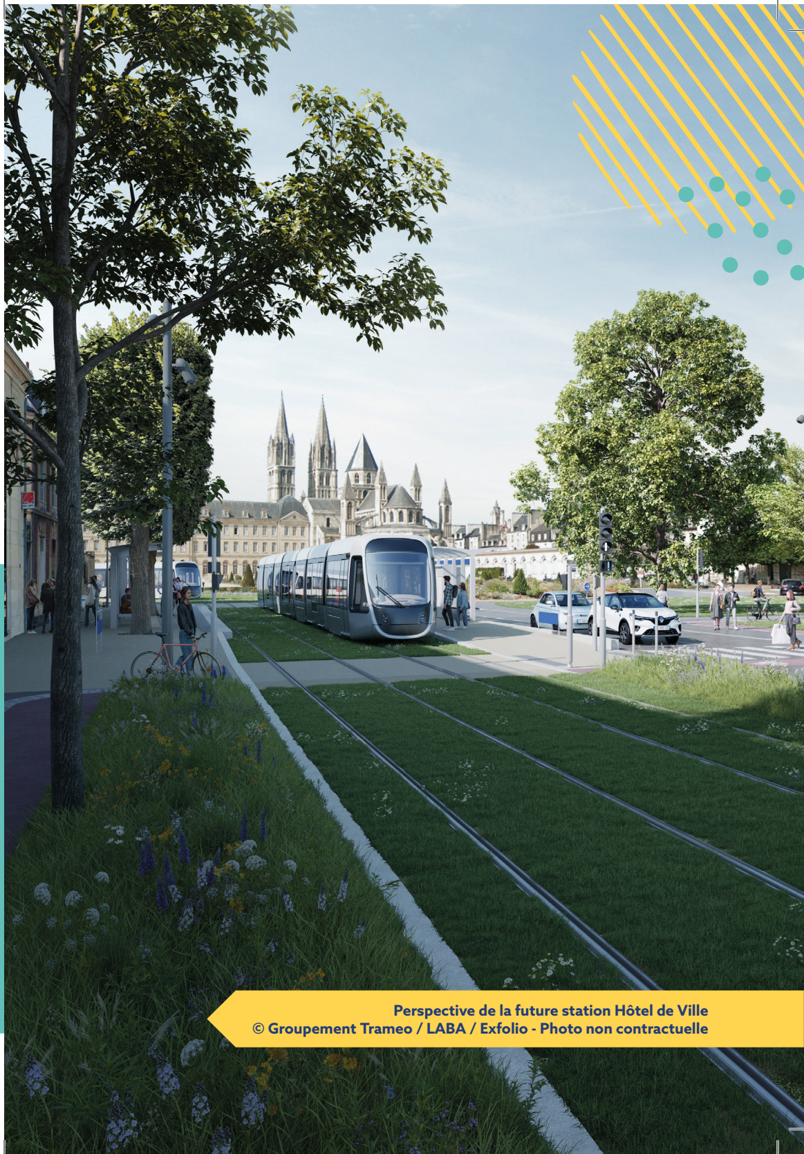
Perspective de la future station Hôtel de Ville © Groupement Trameo / LABA / Exfolio - Photo non contractuelle