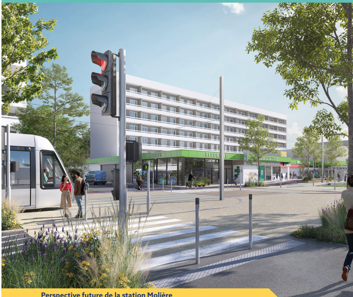
Perspective future de la station Molière

© Groupement Trameo / LABA / Exfolio - Photo non contractuelle